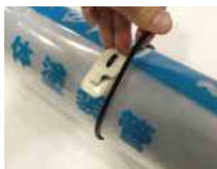
ゴムバンドを1周させる。