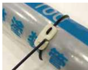
ゴムバンドを手前に引いて絞り、 固定部にゴムバンドを入れて固定。