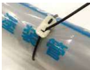
ゴムバンドをスリットに通す。 (仮保持可能)